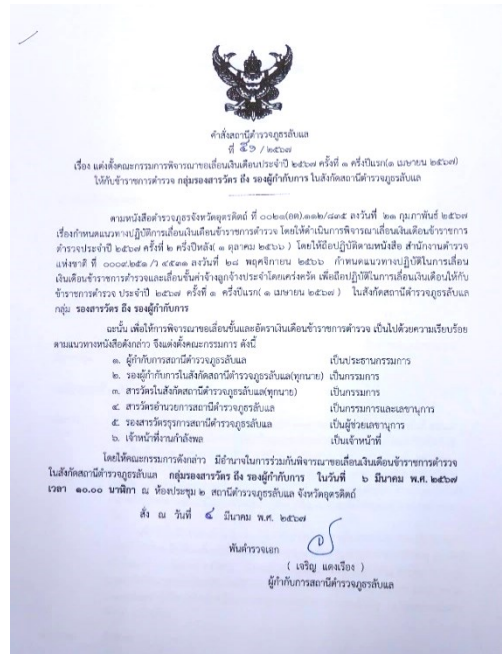
ภาพแสดงคำสั่งแต่งตั้งคณะกรรมการพิจารณาเลื่อนขั้นเลื่อนเงินเดือนของ สก.ลับแล